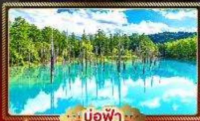
บ่อน้ำฟ้า