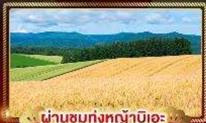
ผ่านชมทุ่งหญ้าปิอะ