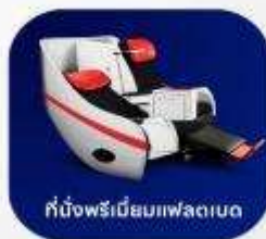
ที่นั่งพรีเมียมเฟลตเบด