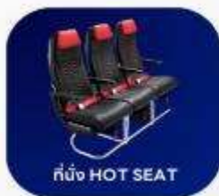
ที่นั่ง HOT SEAT