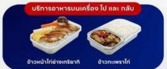
บริการอาหารบนเครื่อง ไป และ กลับ