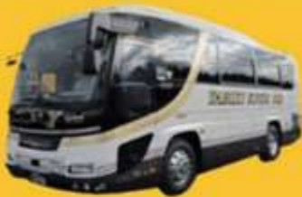
Bus (10-20 ท่าน)

➔ สำหรับท่านที่ต้องการความเป็นส่วนตัวมากขึ้น ท่านสามารถเลือกใช้บริการ รถส่วนตัวได้โดยมีรูปแบบรถให้เลือกถึง 3 ประเภท โดยรถ แต่ละประเภทสามารถนั่งได้ตั้งแต่ 2 ท่านขึ้นไป