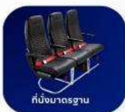
ที่นั่งมาตรฐาน