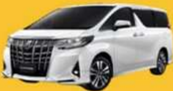
Alphard (2-4 ท่าน)