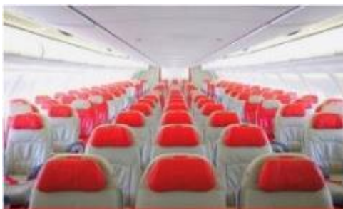
เครื่องบินใหญ่ 377 ที่นั่ง

ตัวเครื่องบินเป็นตัวกรู๊ปสำหรับคณะทัวร์ ระบบของสายการบินจะทำการแรนดอมที่นั่ง ซึ่งไม่สามารถล็อกหรือเลือกระบุที่นั่งได้ หากลูกค้าต้องการเลือกระบุที่นั่ง ทางสายการบินมีบริการอัพเกรดที่นั่ง (ค่าบริการเป็นไปตามที่สายการบินกำหนด)