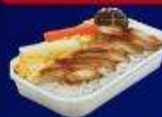
ข้าวหน้าไก่ย่างเทรียกกี