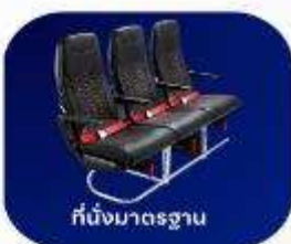
ที่นั่งมาตรฐาน