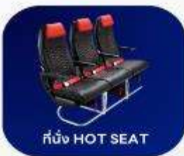
ที่นั่ง HOT SEAT