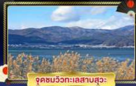
จุดชมวิวกะเลสาบสุวะ