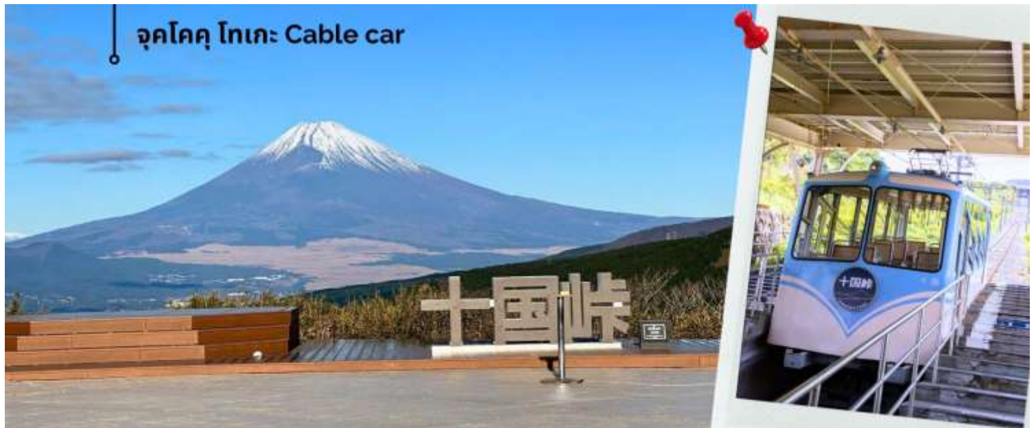
**การมองเห็นภูเขาไฟฟูจิและโตเกียวสกายทรีขึ้นอยู่กับสภาพอากาศ**

เที่ยง รับประทานอาหารเที่ยง ณ ภัตตาคาร พิเศษ เมนู !! บุฟเฟต์ ปังย่าง ยากินิกุ (2) หลังรับประทานอาหารเที่ยง นำท่านเดินทางสู่ จังหวัดชิซุโอกะ (ใช้เวลาเดินทางประมาณ 1 ชั่วโมง 50 นาที) นำท่านขึ้น เคเบิลคาร์ จุกโคคุ โทเกะ (Jukokoku Toge) รวมค่าเคเบิลคาร์ ขึ้น-ลง เพื่อชมภูเขาไฟฟูจิ จุกโคคุ โทเกะ ตั้งอยู่บนความสูงถึง 770 เมตรเหนือระดับน้ำทะเล และอยู่ระหว่างชายขอบเมืองอาตามิ (Atami) และเมืองคังนามิ (Kannami) จังหวัดชิซุโอกะด้วยความสูงระดับนี้ ทำให้เราสามารถมองเห็นวิวเมืองและภูเขาได้ในระดับ 360 องศา รวมถึงเห็นภูเขาไฟฟูจิได้ทั้งลูก และหอคอย โตเกียวสกายทรี (Tokyo Skytree) ที่เป็นอีกสัญลักษณ์ของกรุงโตเกียว