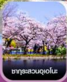
ซากุระสวนอุเอโนะ

คอนเฟิร์มออกเดินทาง ทุกพีเรียด 2 ท่านขึ้นไป