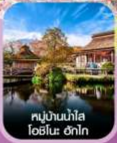
หมู่บ้านน้ำใส โอชิโนะ ฮักไก