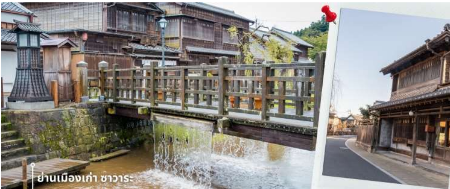
ย่านเมืองเก่า ซาวาระ

หลังรับประทานอาหารเที่ยง นำท่านเดินทางสู่ ย่านเมืองเก่าซาวาระ Sawara Old Town เป็นเมืองเล็กๆ อยู่ไม่ไกลจากโตเกียวหรือที่รู้จักในอีกชื่อว่า โคเอโดะ หรือ เอโดะน้อย เป็นย่านที่ให้ท่านได้สัมผัสกับบรรยากาศยุคเอโดะของญี่ปุ่น (ค.ศ. 1603 - ค.ศ. 1867) บรรยากาศเมืองเก่าที่เต็มไปด้วยกลิ่นอายสมัยเอโดะที่ยังคงความดั้งเดิมไว้อย่างดี ทั้งสถาปัตยกรรม ตึกที่ยังคงความเก่าราวกับย้อนยุค วิถีชีวิตชาวบ้านที่ยังคงเอกลักษณ์เฉพาะตัว งานฝีมือแบบดั้งเดิม และประวัติศาสตร์ความเป็นอยู่ของพื้นที่ ไฮไลท์อีกหนึ่งสิ่งที่ไม่ควรพลาดของซาวาระคือ สะพานจจา (Ja Ja Bridge) สะพานที่มีน้ำไหลออกมาจากทั้งสองด้านเหมือนน้ำตก เป็นเอกลักษณ์ที่โดดเด่น ให้ท่านได้อิสระเดินชมบรรยากาศและเก็บภาพความประทับใจ