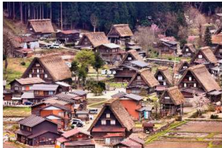
รูปใช้เพื่อประกอบการโฆษณาเท่านั้น