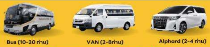
Bus (10-20 ท่าน)

สำหรับท่านที่ต้องการความเป็นส่วนตัวมากขึ้น ท่านสามารถเลือกใช้บริการ รถส่วนตัวได้ โดยมีรูปแบบรถให้เลือกถึง 3 ประเภท โดยรถ แต่ละประเภท สามารถนั่งได้ตั้งแต่ 2 ท่านขึ้นไป