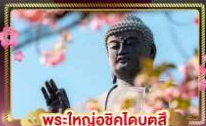
พระใหญ่อุซึคุโดบุคสี