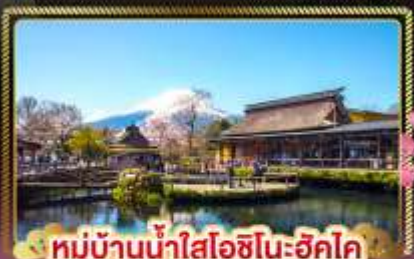
หมู่บ้านน้ำใสโอชิโนะฮักโค