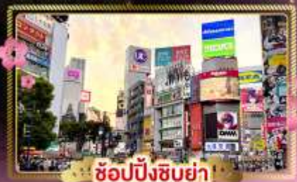
ช้อปปิ้งชิบูย่า