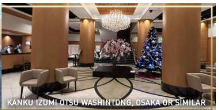
KANKU IZUMI OTSU WASHINTONG, OSAKA OR SIMILAR