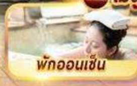
ฟักออนเซ็น