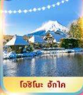
โชนินะ ฮักโค