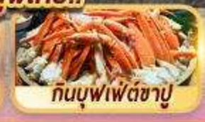
กัมบุฟเฟตซาบู