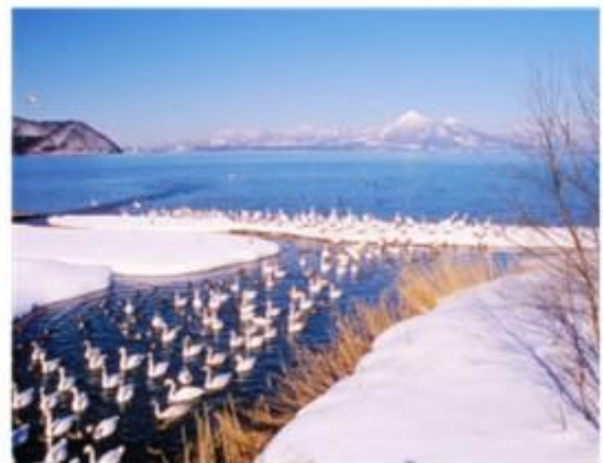
ทะเลสาบอินาวะชิโร Inawashiro-ko