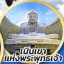
เป็นเขา แห่งพระพุทธรเจ้า

ชมความน่ารักของสัตว์ต่างๆ ที่พิพิธภัณฑ์สัตว์น้ำโอตารุ