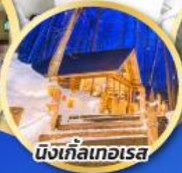
นิงเกิ้ลเทอเรส