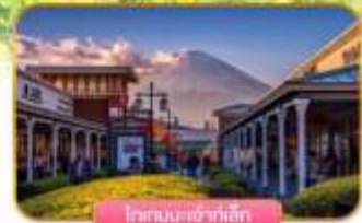
โรงแรมเจ้าฟ้าสิริ