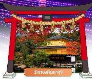
วัดทองคินคะคุจิ