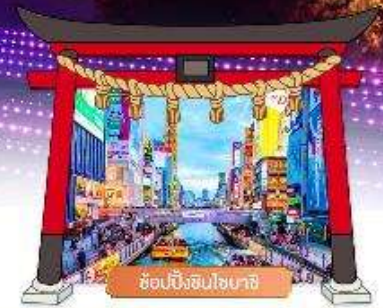
ช้อปปิ้งชินไซบาชิ

เดินทางโดยสายการบิน : ไทยแอร์เอเชียเอ็กซ์