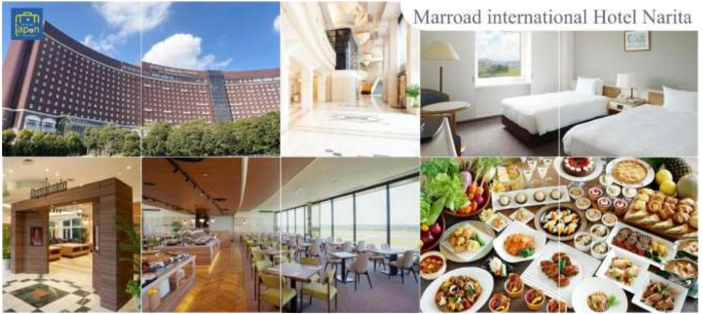
Marroad international Hotel Narita

MARROAD INTERNATIONAL HOTEL NARITA หรือเทียบเท่าระดับเดียวกัน