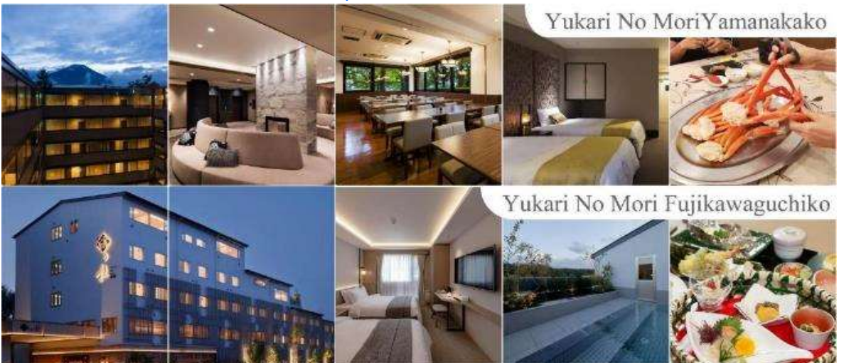
Yukari No Mori Yamanakako