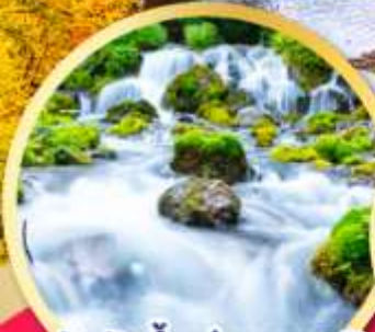
สัมผัสน้ำแร่ธรรมชาติ ณ สวนฟูทาคาชิ