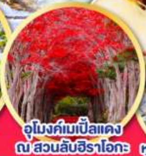
อุโมงค์ไม้แป้นแดง ณ สวนลึบชิราโอกะ