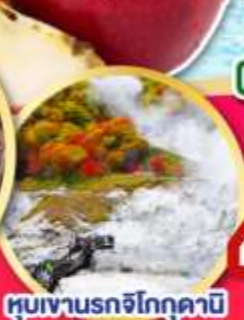
หุบเขานรกจิทอกุดานิ