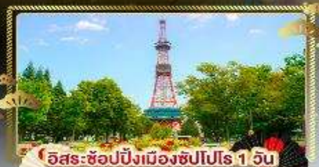
อิสระ-ช้อปปิ้งเมืองซัปโปโร 1 วัน