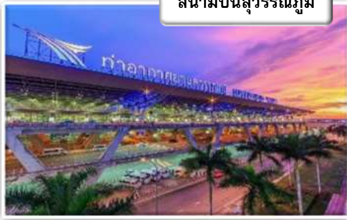
สนามบิสสุวรรณภูมิ

เวลา 19.00 น. พร้อมกันที่ สนามบิสสุวรรณภูมิ อาคารผู้โดยสารขาออกระหว่างประเทศเคาน์เตอร์ สายการบินไทยแอร์เวย์เจ้าหน้าที่คอยให้การต้อนรับ ดูแลด้านเอกสาร เช็คอิน และสัมภาระในการเดินทาง