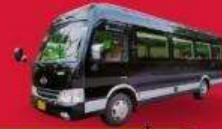
BUS (10-18 ท่าน)