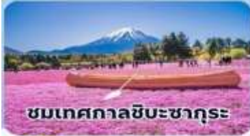
ชมเทศกาลชิบะซากุระ