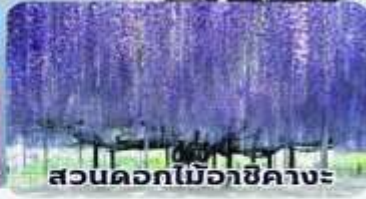
สวนดอกไม้เอจิคาเงะ