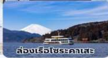
ล่องเรือไซระคาเสะ