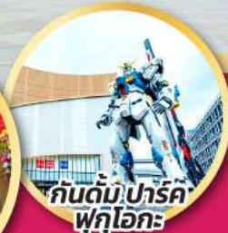
กันดั้ม ปาร์ค ฟุกุโอกะ