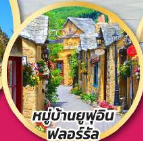
หมู่บ้านยูฟูอิน พลอร์ริล