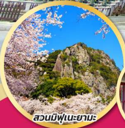
สวนมิฟูเนะยามะ