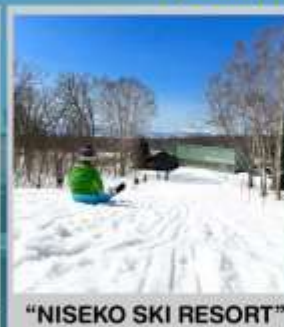
"NISEKO SKI RESORT"