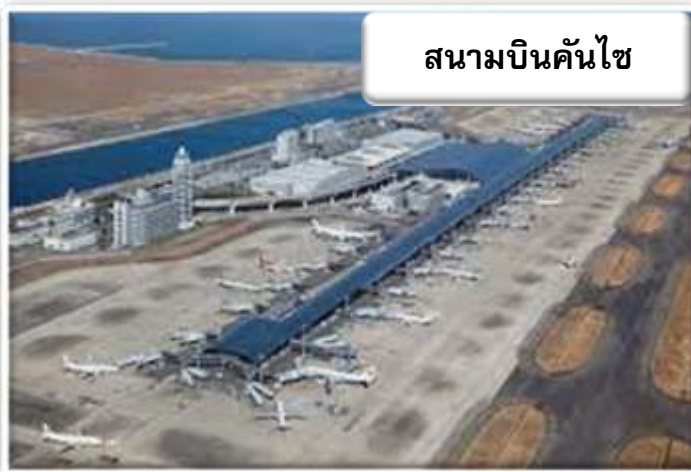
สนามบินคันไซ

บริการอาหารร้อนบนเครื่องพร้อมกับเมนูผลไม้สดเพื่อเติมเต็มความพิเศษไปพร้อมกับความสดชื่น