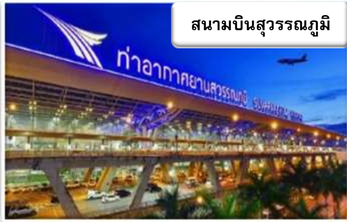
สนามบินสุวรรณภูมิ

เวลา 05.00 น. พร้อมกันที่ ท่าอากาศยานสุวรรณภูมิ อาคารผู้โดยสารขาออกระหว่างประเทศ เคาน์เตอร์ สายการบินไทย เจ้าหน้าที่คอยให้การต้อนรับ ดูแลด้าน เอกสาร เช็คอิน และสัมภาระในการเดินทาง เวลา 08.55 น. ออกเดินทางสู่ สนามบินคันไซ ประเทศญี่ปุ่น โดยสายการบินไทย เที่ยวบินที่ TG 672