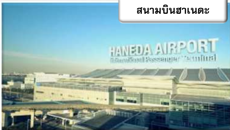
สนามบินฮาเนดะ

เวลา 06.55 น. เดินทางถึง สนามบินฮาเนดะ ประเทศญี่ปุ่น นำท่านผ่านขั้นตอนการตรวจคนเข้าเมืองและศุลกากร