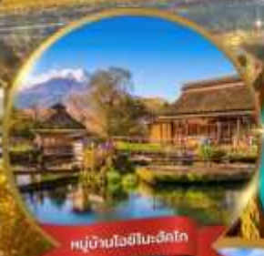
หมู่บ้านโอชิโนะฮักโก