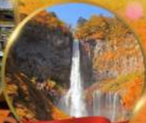
น้ำตกเคกอน