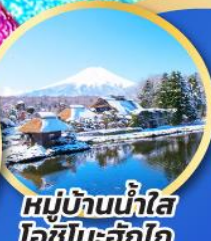
หมู่บ้านน้ำใส โอชิโนะอึกิโกะ