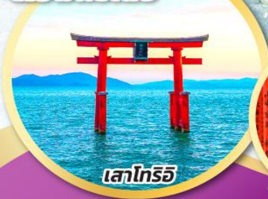
ทะเลทริอู