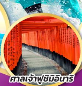
ศาลเจ้าฟูชิมิอันริ