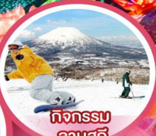
กิจกรรม ลานสกี