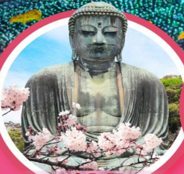
หลวงพ่อดโตบุตสึ