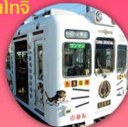
นั่งรถไฟทามะ