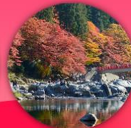
คุมโนโคดงเค