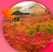
วัดโทฟุคุจิ