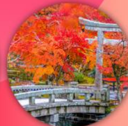
วัดเออิคังโตะ