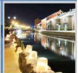
"OTARU CANAL FEST"