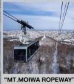
"MT. MOIWA ROPEWAY"