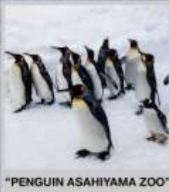
"PENGUIN ASAHIYAMA ZOO"