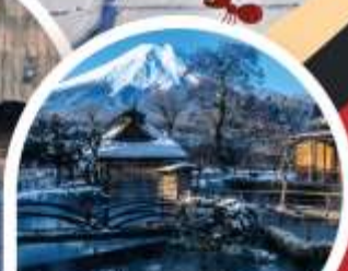
หมู่บ้านโอฮิโนะฮักโก

นาโงยา ◦ ทาคายามา ◦ มัตสึโมโด้ ◦ ทะเลสาบยามานาคาโกะ ◦ โตเกียว