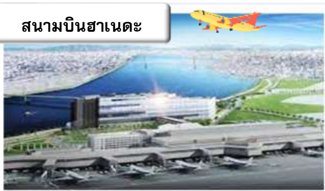
สนามบินฮานอย

22.45 น. ออกเดินทางสู่ สนามบินฮานอย ประเทศญี่ปุ่น โดย สายการบินไทย เที่ยวบินที่ TG 644