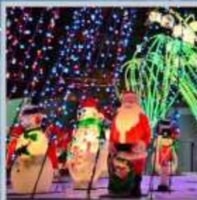
"ODORI GERMAN CHRISTMAS"