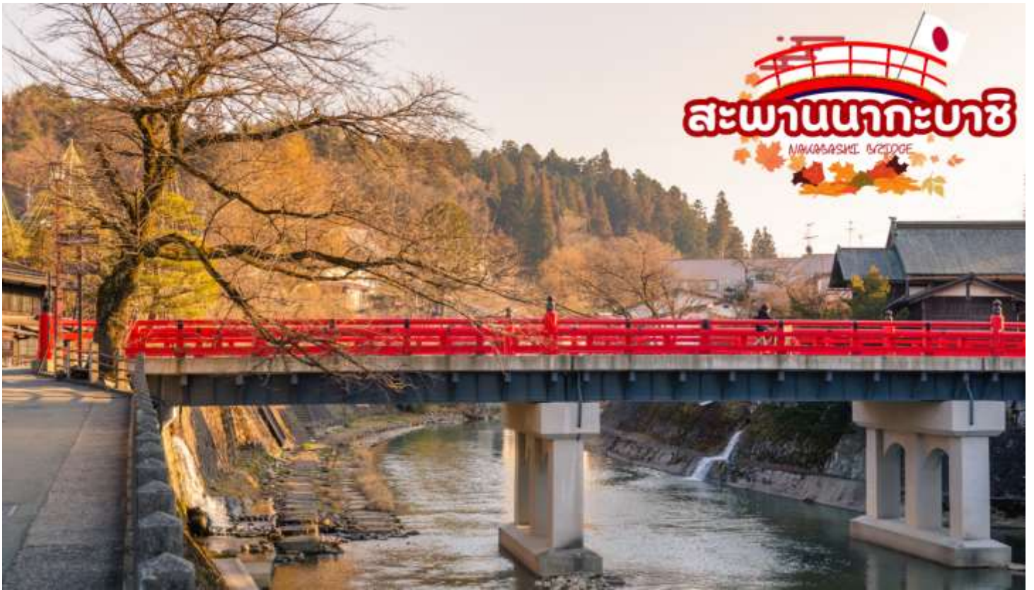
สะพานนาคะบาชิ (Nakabashi Bridge) สะพานสีแดงของย่านเมืองเก่า สะพานทอดข้ามแม่น้ำมิกากาวะที่ไหลผ่านใจกลางเมือง สะพานแห่งนี้ถือเป็นสัญลักษณ์ของเมืองทาคายาม่า