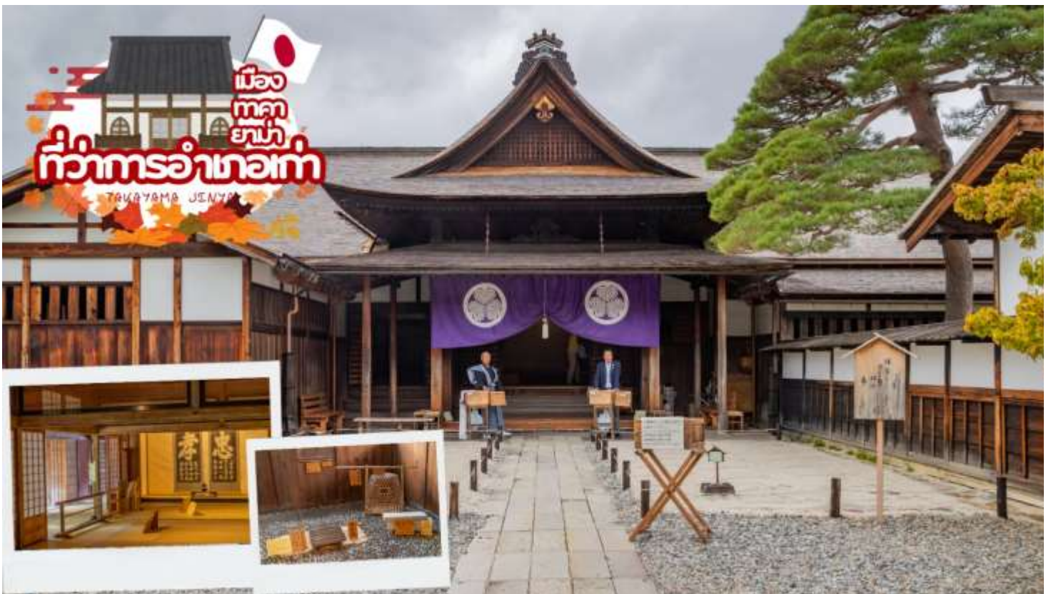
ผ่านชม ทาคายาม่า จินยะ หรือ ที่ว่าการอำเภอเก่าเมืองทาคายาม่า (ไม่รวมค่าเข้าชม) ซึ่งเป็นจวนผู้ว่าแห่งเมืองทาคายาม่า เป็นที่ทำงานและที่อยู่อาศัยของผู้ว่าราชการจังหวัดฮิดะ เป็นเวลากว่า 176 ปี