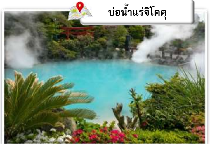
บ่อน้ำแร่จิโคคุ

เดินทางสู่ บ่อน้ำพุร้อน (Jigoku Meguri) หรือ บ่อน้ำพุร้อนขุมนรกทั้งแปด เป็นบ่อน้ำพุร้อนธรรมชาติที่เกิดขึ้นภายหลังจากการระเบิดของภูเขาไฟ ประกอบไปด้วยแร่ธาตุที่เข้มข้น เช่น กำมะถัน แร่เหล็ก โซเดียม คาร์บอเนต เรเดียม เป็นต้น และร้อนเกินกว่าจะลงไปอาบได้ แล้วบ่อทั้ง 8 บ่อ ก็ตั้งชื่อให้แปลกตามลักษณะภายนอกที่เห็นกัน