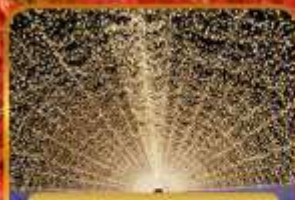
นาบะเนะโนะซาโตะ