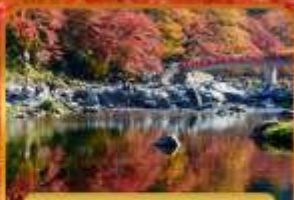
หุบเขาโคริงเค