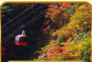
นั่งกระเช้าภูเขาโทโฮไซ