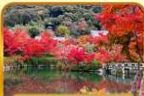
วัดเออิทังโด