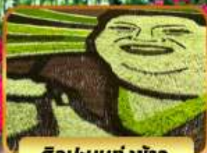
ศิลปะบนทุ่งข้าว