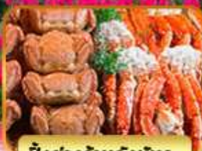
บึงย่างร้านดังนั้นดะ