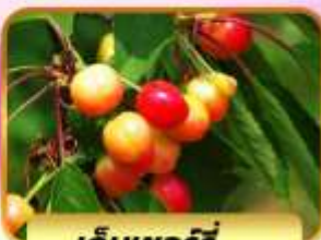
เก็บเชอร์รี่

20-25 ส.ค., 27 ส.ค.-01 ก.ย. 03-08 ก.ย. 2567