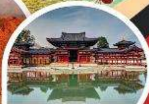
วัดเมียวโดอิน