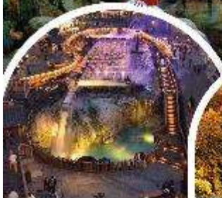
คุซัทสึออนเซ็น