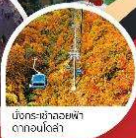
มังกร-ซาลอยฟ้า ตาก่อนโตซ่า

ควารุโกะ : ๐ นาโอมะ : ๐ ทาการากิ : ๐ คุซัทสึ : ๐ ยูซากาตะ : ๐ นิทานานิ : ๐ โตเกียว