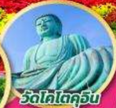
วัดโคโตะคุจิ