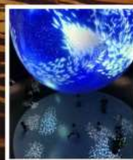
พิพิธภัณฑ์สัตว์น้ำนิเพส