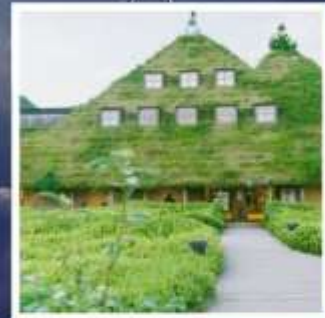
ลา โคสึน่า โอมิสะจิมัง

พิเศษท่องเที่ยวสวนสนุกยูนิเวอร์ซัล สตุดีโอส์เต็มวัน สวนสาธารณะซากุระปราสาทคาเคโกะ 1 ใน 3 สุดยอดจุดชมซากุระแห่งญี่ปุ่น สักการะพระพุทธรูปในอาคาร ที่ใหญ่ที่สุดในญี่ปุ่น เอจิเซ็นโดบุตสึ เปิดประสบการณ์อัศจรรย์กำแพงหิมะ บนเทือกเขาเจแปนแอลป์ ชมประวัติศาสตร์และร้านขนมดังลา โคสึน่า แห่งเมืองโอมิสะจิมัง พักผ่อนเป็นอย่างดี 3 คืน 2 ริมทะเลสาบ!!! อาหารพิเศษ...บุฟเฟ่ต์อาหาร + เครื่องดื่มแอลกอฮอล์ไม่อั้น กรุ๊ปสบายๆ เพียง 20 ท่านเท่านั้น!!!