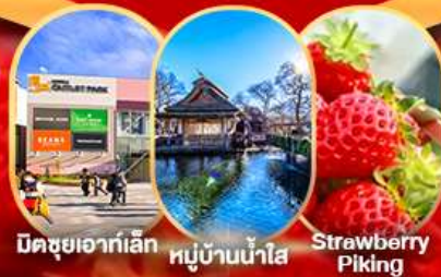
มิดซูยาเอ็กซ์เพลส

Strawberry Piking ลานสกี มินาตามิ ออนเซน ยูนาตากะ: สวนสาธารณะโอมิโอะซิดาชิ ถนนช้อปปิ้งคารุอิซาเว-กินซ่า หมู่บ้านน้ำใส โอชิโนะอากิโกะ ซงซาแบบญี่ปุ่น หรือ พิพิธภัณฑ์ แผ่นดินไหว จุดพักรถกลางทะเล โตเกียวเบย์ แคนนอน มิดซูยาเอ็กซ์เพลส อีออนมอลล์