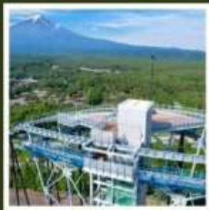
ฟูจิยามะ ทาวเวอร์