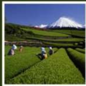
ไร่ชาโอบุจิชะชะบะ