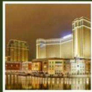
เดอะ เวเนเชียน

ฟูจิยามะ ทาวเวอร์ ขึ้นชมฟูจิจากสวนสนุกที่ไม่เหมือนใคร ชมไร่ชาโอบุจิชะชะบะ อันเลื่องชื่อ