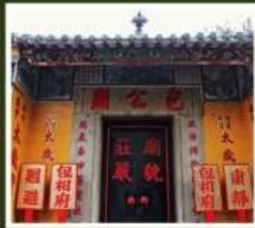
วัดเปากง