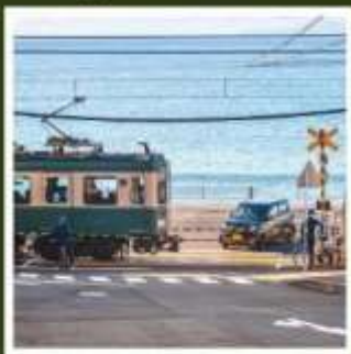
รถไฟเอโบะเด็น