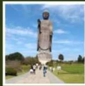
พระพุทธรูปอชิคุโตบุทสึ