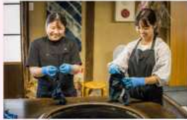
MAKE INDIGO DRING