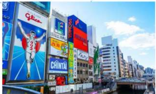
SHOPPING AT SHINSAIBASHI

"โรงงานชิกิกะโช" ชมมินิรูสมน ของฝากสุดคลาสสิกจากโอซาก้า มีขนมหวานมากกว่า 100 ชนิด รวมถึงขนมและเค้กญี่ปุ่น ท่านสามารถเพลิดเพลินกับการช้อปปิ้งขนมหวานได้ตามใจชอบ