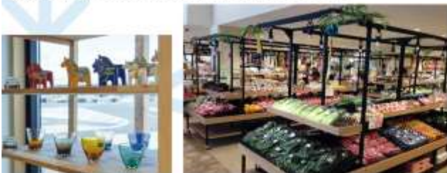
SHOP AT GOOD YAMAGATA & MICHINOEKI ZAO

อิสระช้อปปิ้ง “มิชิโนะเอกิ ซาโอะ” ตลาดเกษตรกรของแท้ที่จำหน่ายผลิตภัณฑ์ในท้องถิ่นหลากหลายประเภท เป็นสถานที่พิกัดรวมทางที่มีชื่อเสียงและเป็นประตูสู่ภูเขาซาโอะ หนึ่งในแลนด์มาร์คสำคัญของจังหวัดยามาغاتะ