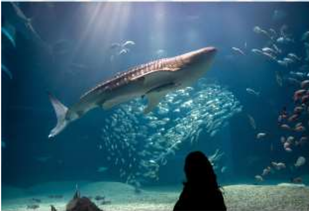
VISIT KAIYUKAN AQUARIUM

เดินทางสู่ "นครโอซาก้า" เมืองแห่งรอยยิ้มและอาหารอร่อยเต็มไปด้วยชีวิตชีวาและวัฒนธรรมอันเป็นเอกลักษณ์ของญี่ปุ่น ตั้งอยู่บนเกาะฮอนชู เป็นเมืองที่มีขนาดเศรษฐกิจใหญ่เป็นอันดับ 2 และมีประชากรมากเป็นอันดับ 3 ของประเทศ