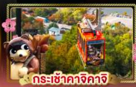
กระเช้าคาจิคาจิ